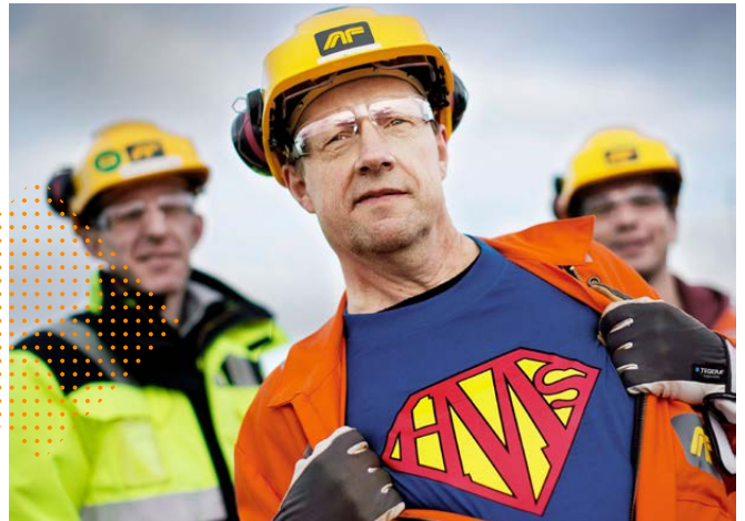
HMS GIR KRAFT: God HMS er verdiskapende, det jobbes mer effektivt og det gir konkurransekraft.