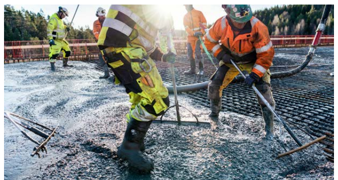
STØPER: Den største støpen som er gjort på E18-anlegget. Bruspenet på Årdalen bru i Tvedestrand.