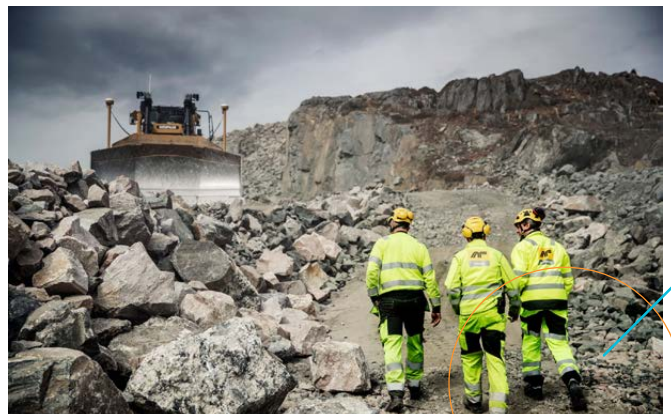
PROSJEKT E18: Ansatte på befaring ved anlegget til Nye veier.